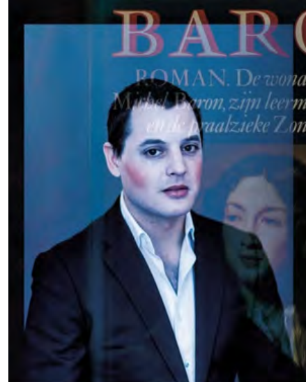
Molière et Moi, magnifique Holland Baroque